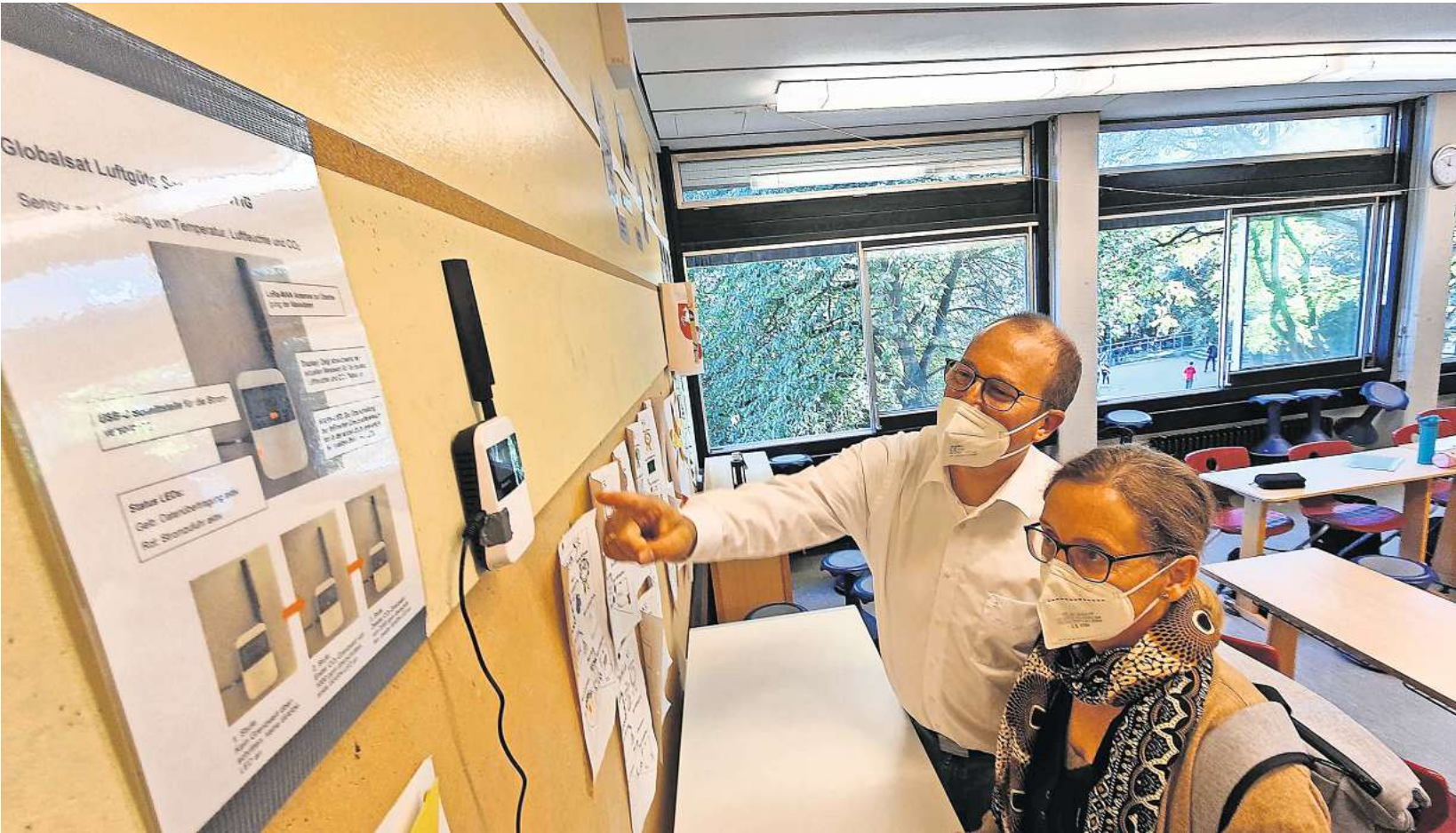
In der Albert-Einstein-Schule messen bereits seit längerem einzelne Testgeräte die CO 2 -Konzentration in der Luft.

Die Albert-Einstein-Schule und das Erich-Kästner-Gymnasium haben solche Geräte seit rund einem Jahr in einigen Räumen versuchsweise im Einsatz. Wie jetzt bekannt wurde, hat die Erich-Kästner-Oberschule solche Geräte sogar flächendeckend im Rahmen des Förderpro-